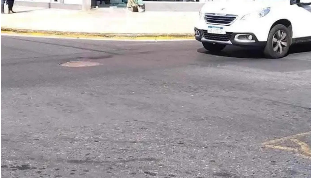
Credipaz s a cdad autonoma de buenos aires