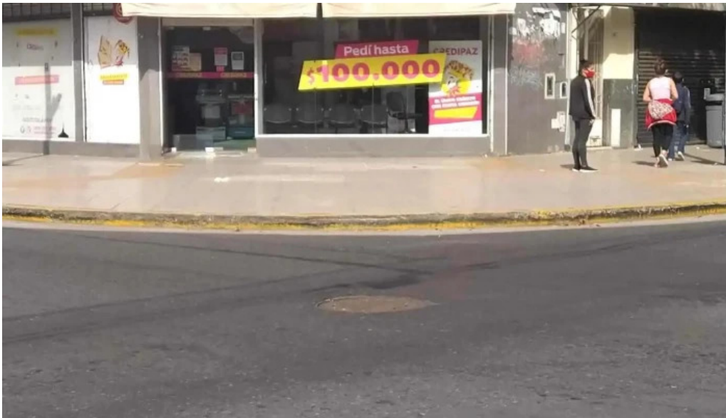
Credipaz sa exterior