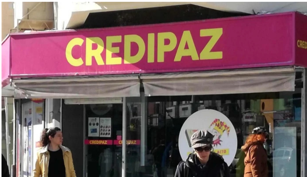
Credipaz sa instagram