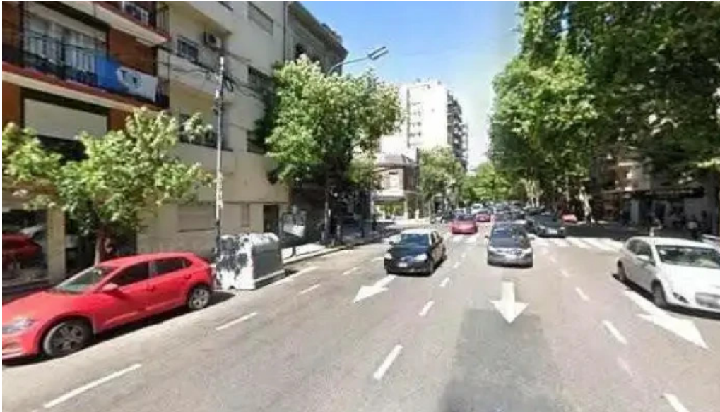
Cooperativa 2001 como llegar