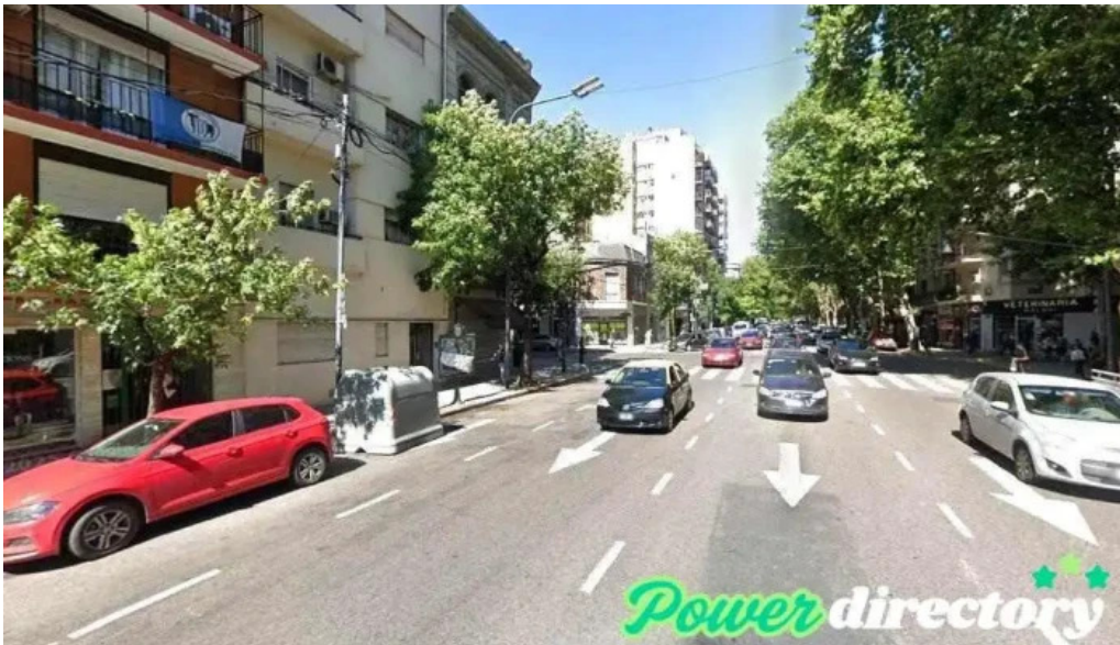
Cooperativa 2001 cdad autonoma de buenos aires