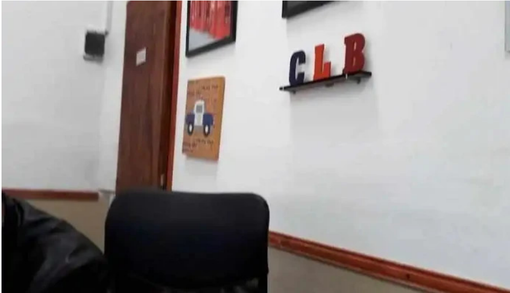
Clb servicios financieros cdad autonoma de buenos aires