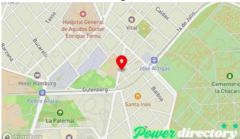
Clb servicios financieros mapa