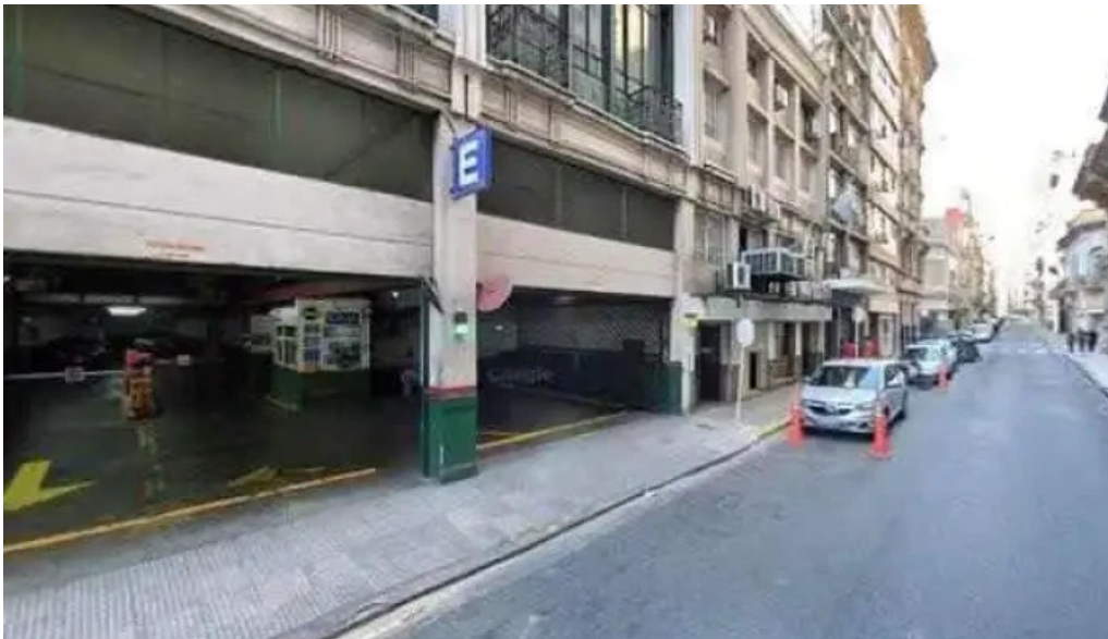
Afinidad comercial descuentosdeg