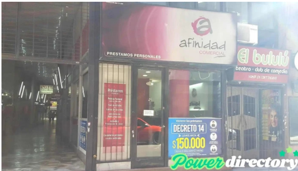
Afinidad comercial del propietario