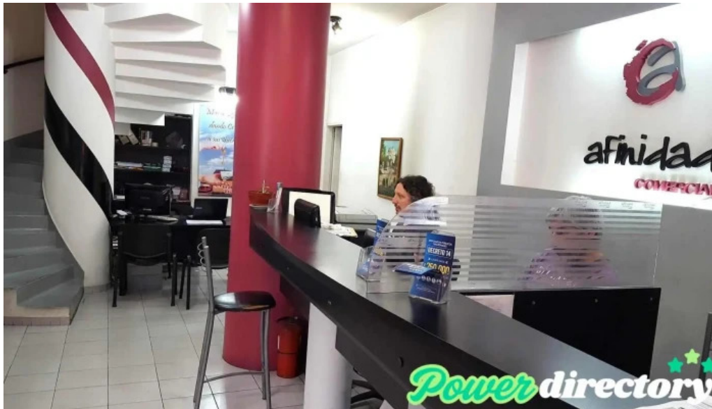
Afinidad comercial cdad autonoma de buenos aires