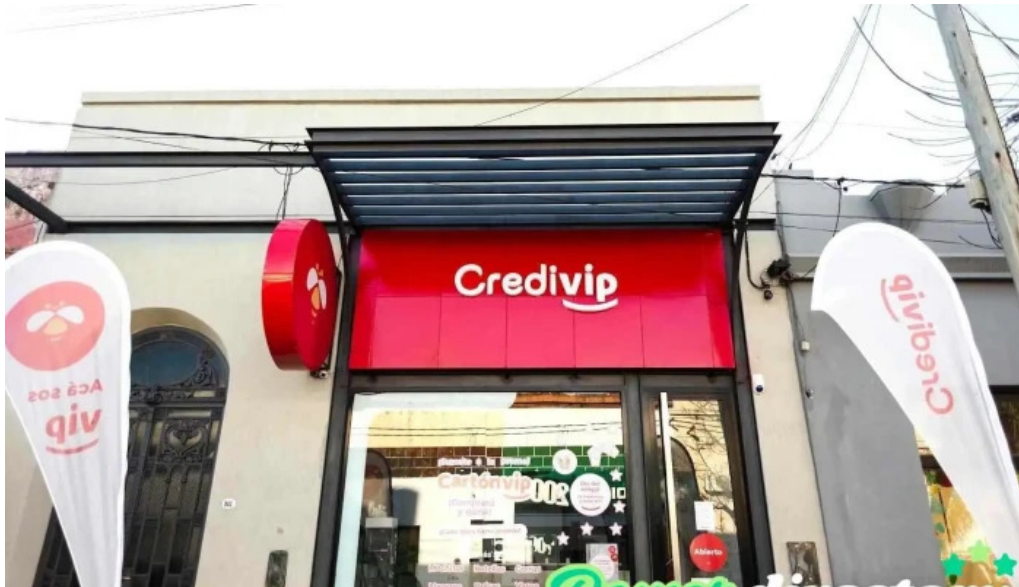
Credivip bella vista