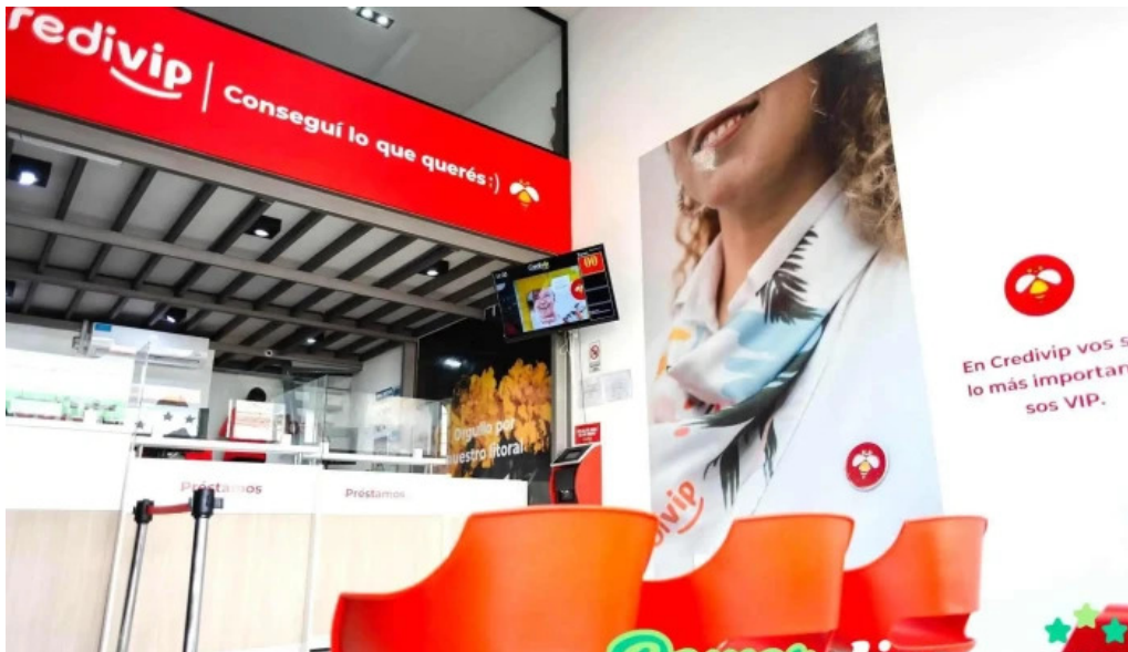
Credivip del propietario