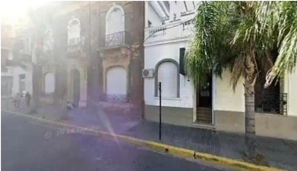
Creditos santo tome promociondeg