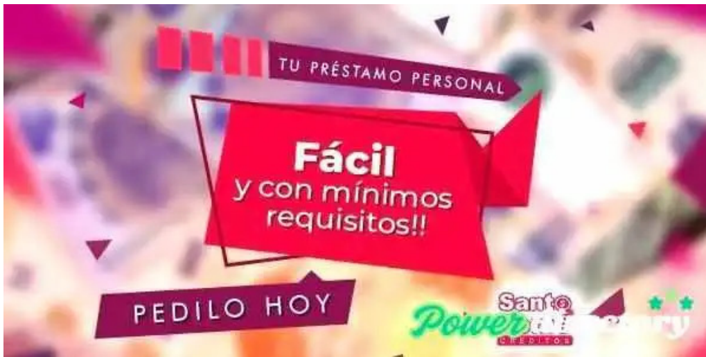
Creditos santo tome promocion