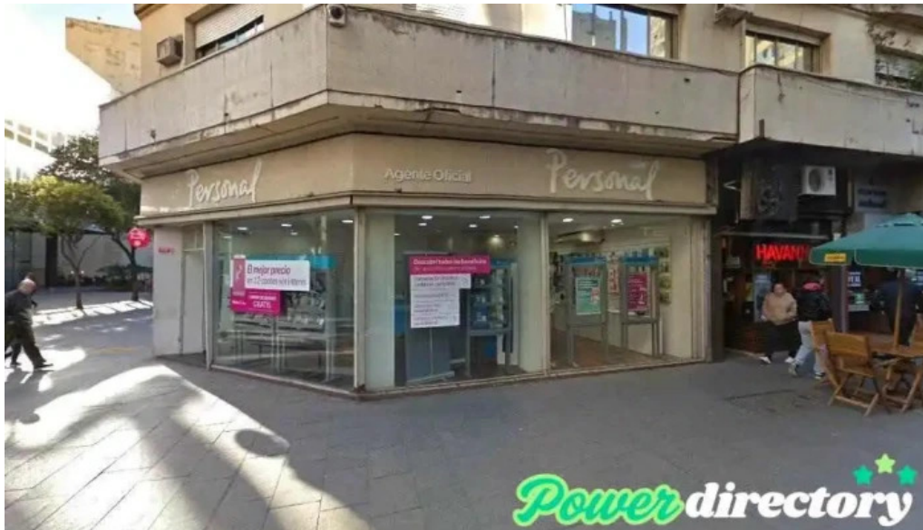
Prestamos personales 954 awl