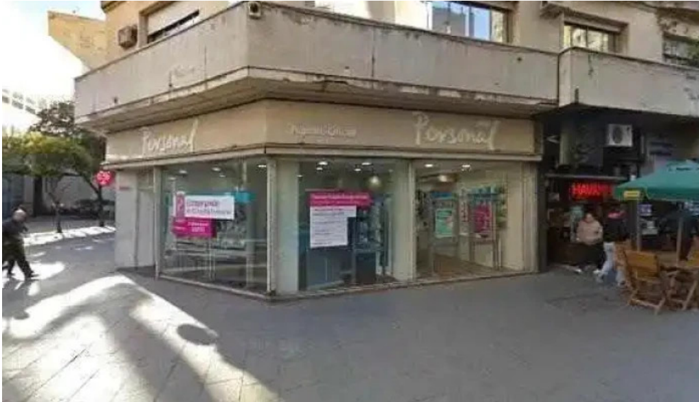
Prestamos personales 954 telefono