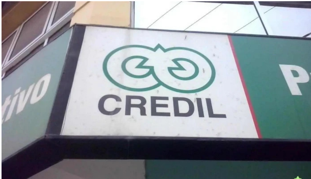
Credil s r l aguilares