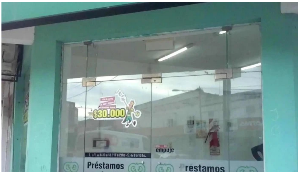
Credil srl exterior