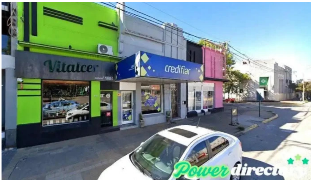
Credifiar suc esperanza aed