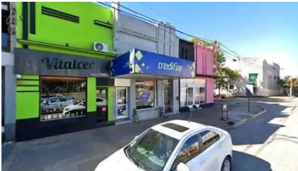
Credifiar suc esperanza telefono