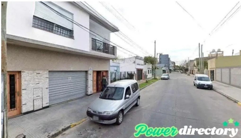
Corporacion argentina de credito quilmes