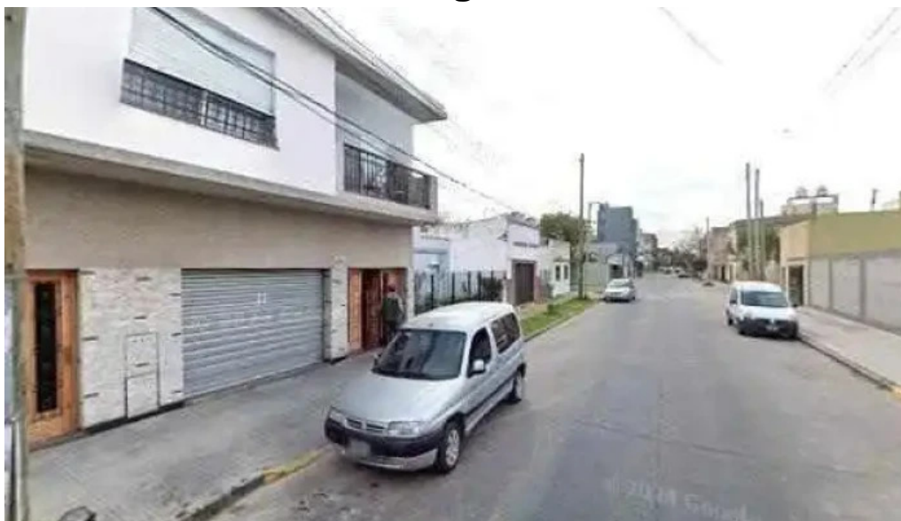
Corporacion argentina de credito ubicacion