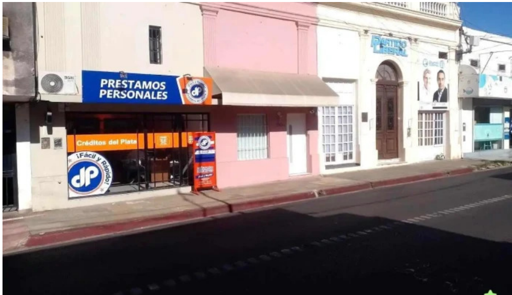
Creditos del plata corrientes