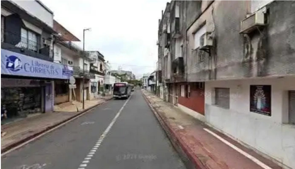
Creditos del plata abierto ahoradeg