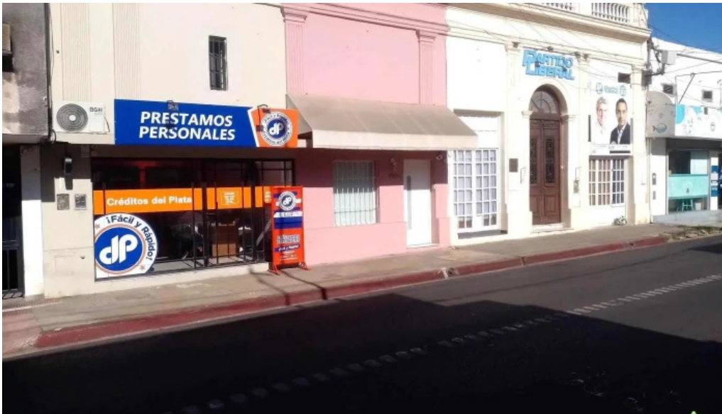
Creditos del plata abierto ahora