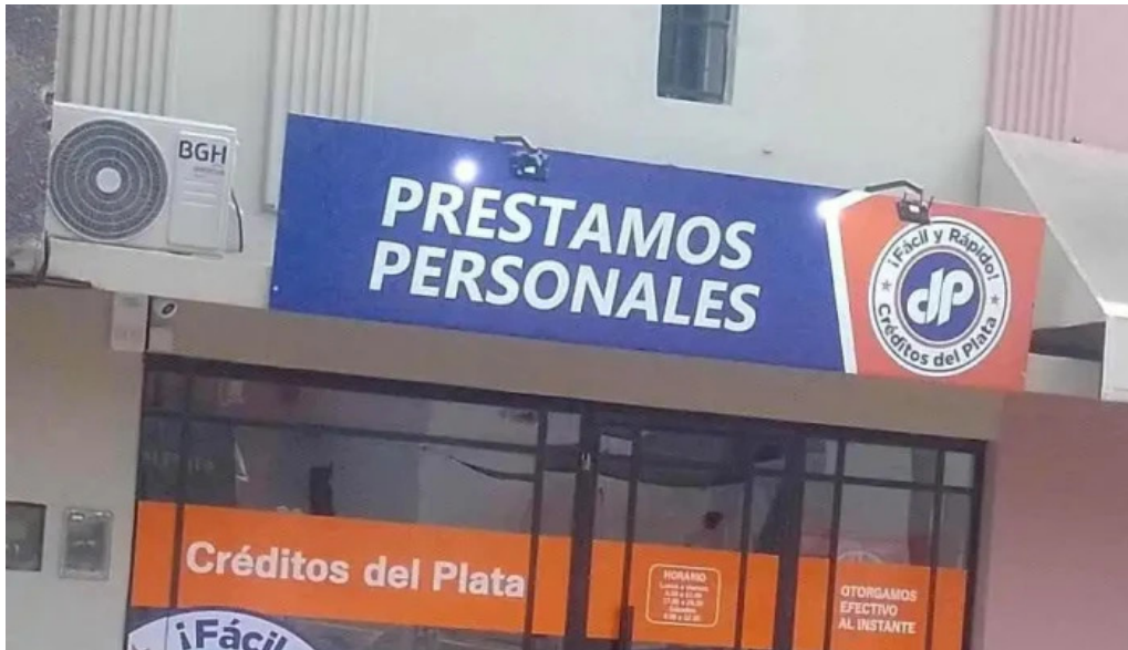
Creditos del plata exterior