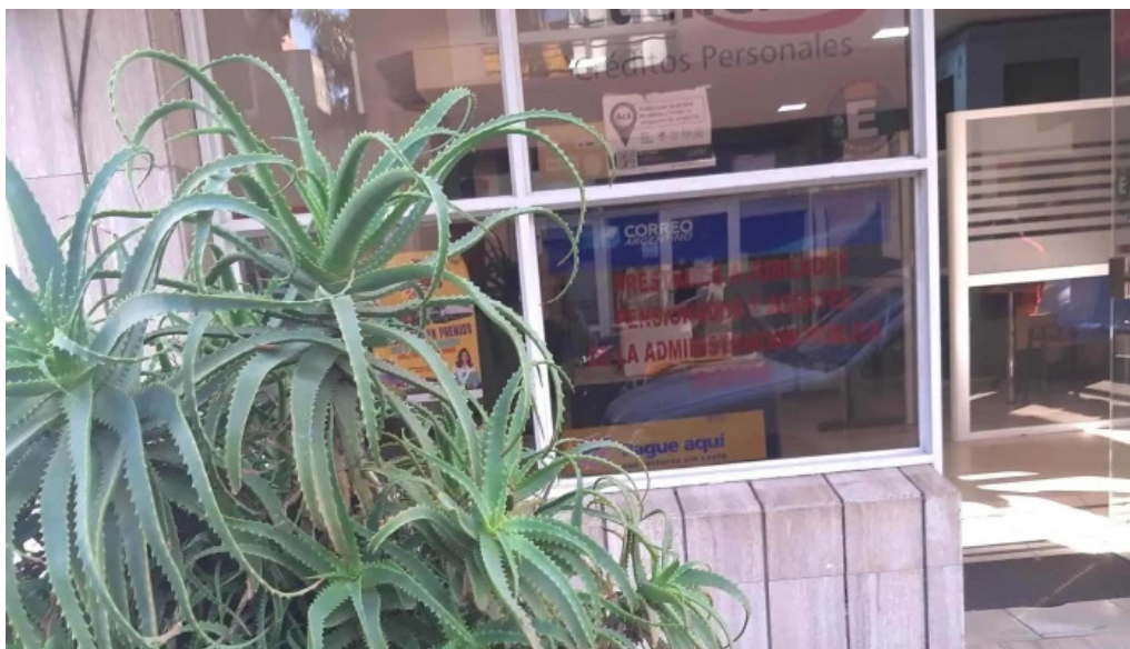
La solucion bell ville