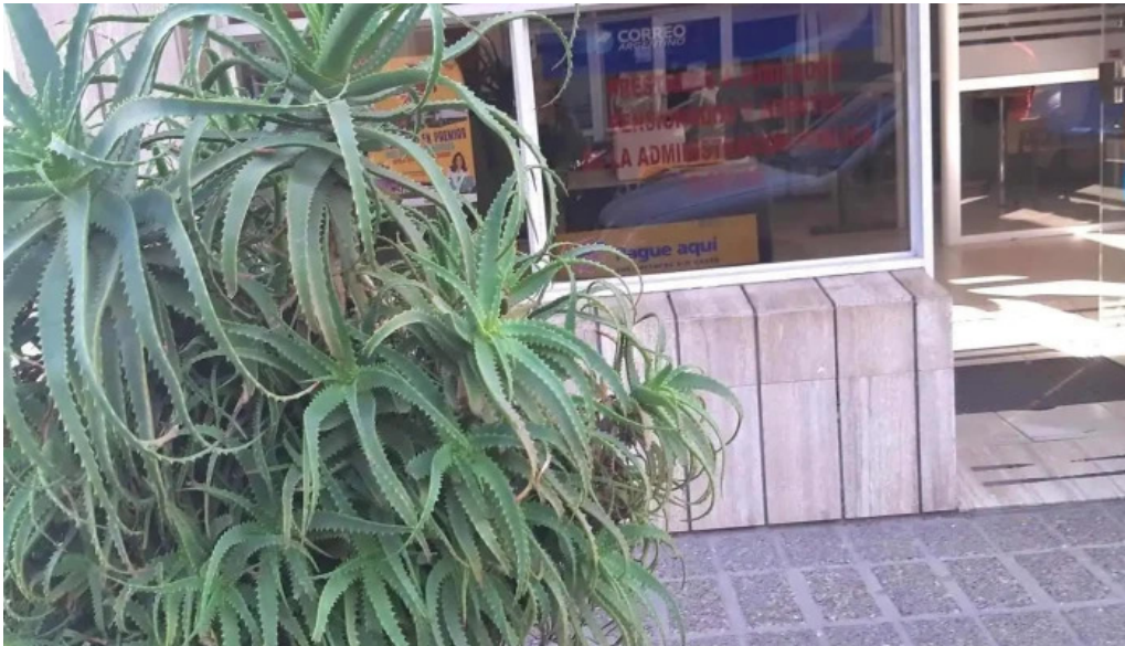
La solucion puntaje