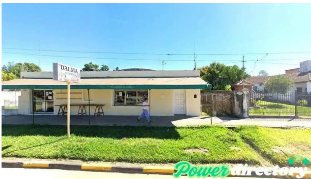
Loteria de corrientes perugoria