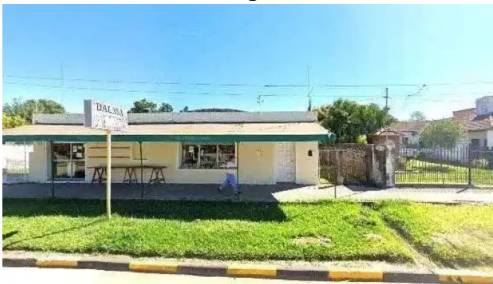
Loteria de corrientes ubicacion